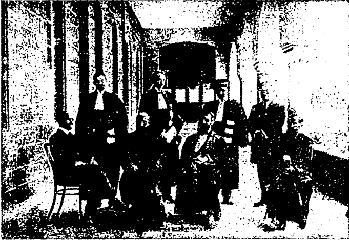
Les Professeurs de l'Ecole de droit en 1924