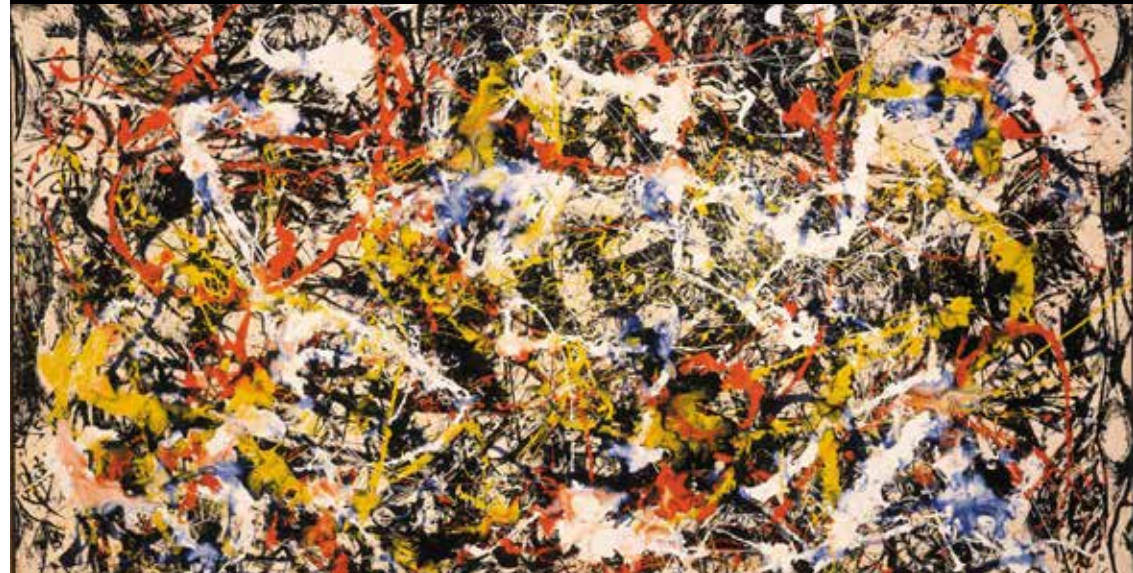
Tableau : «Convergence» de Jackson Pollock - 1952 - Albright-Knox Art Gallery, Buffalo, NY