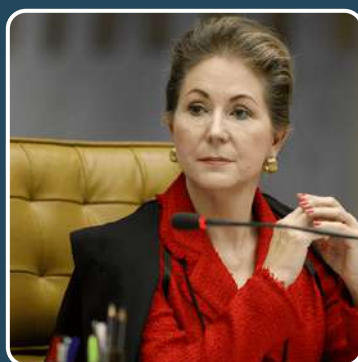
Ministra Ellen Gracie Northfleet

Vice-présidente de la Chambre de conciliation, médiation et arbitrage du CIESP/FIESP, ministre à la retraite et ancienne présidente du Supremo Tribunal Federal (STF).