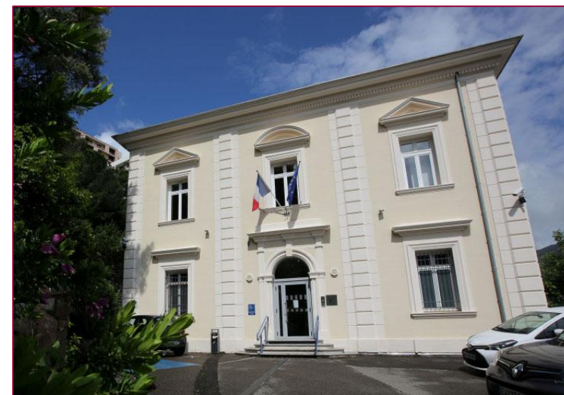
Tribunal administratif de Bastia, Villa Montepiano