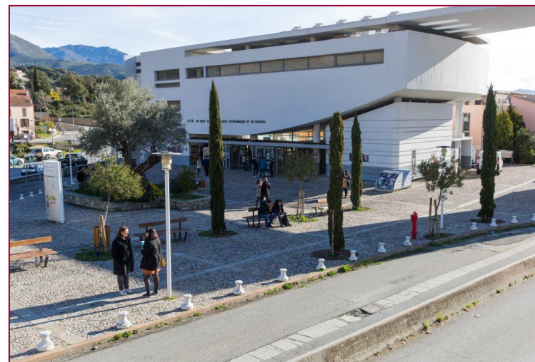
Parvis de la Faculté de droit et de science politique de l'Université de Corse