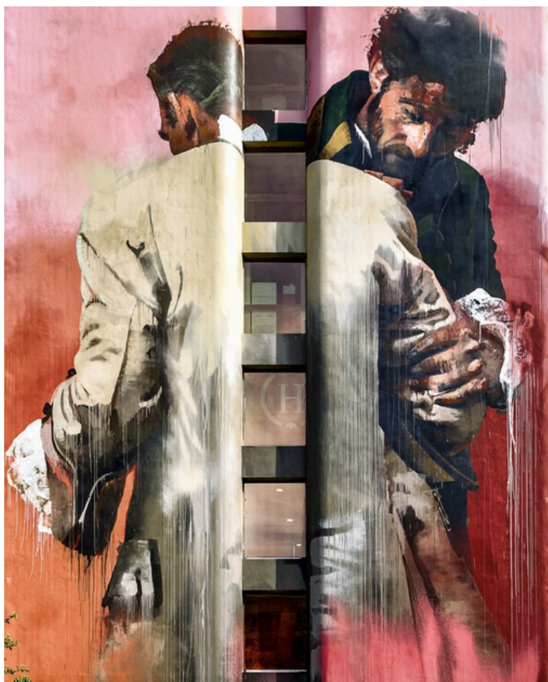
Conor Harrington, Etreinte et lutte , façade du 85 boulevard Vincent Auriol 75013 Paris