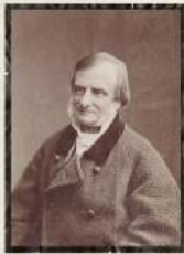
Émile ACOLLAS (1826-1891)