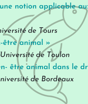
Table ronde 2 - Quelle intensité de protection pour le bien-être animal ?

Sous la présidence de Patrick Meunier, Professeur de droit public, Université de Lille