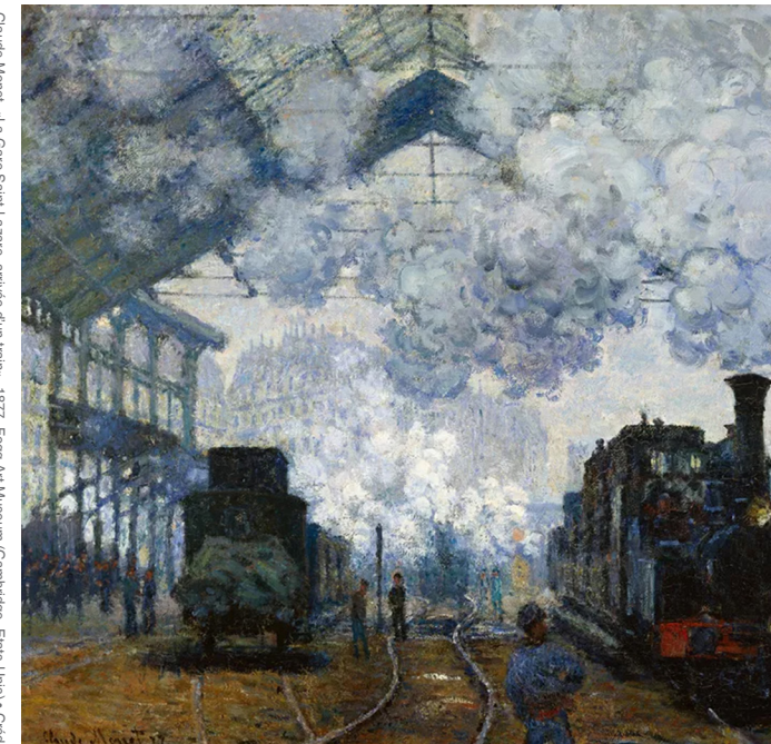
Claude Monet, «La Gare Saint-Lazare, arrivée d'un train», 1877, Fogg Art Museum (Cambridge, États-Unis)

droit-eco-gestion.univ-rouen.fr ou curej.univ-rouen.fr