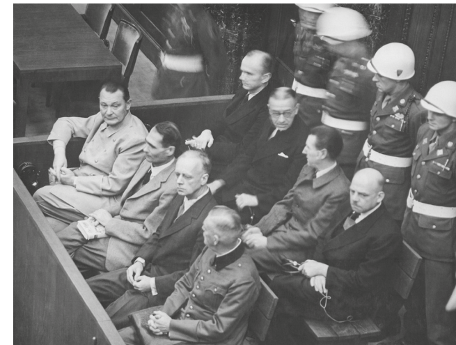
Procès de Nuremberg. Les accusés dans leur box, circa 1945-1946