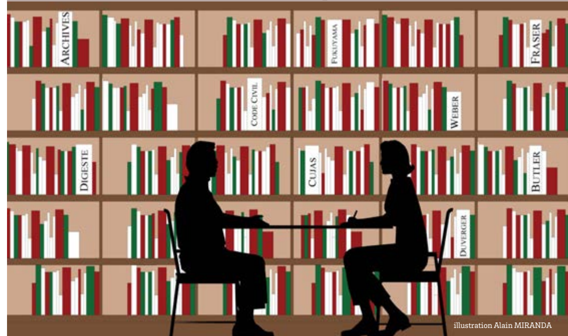
illustration Alain MIRANDA

Organisé par les doctorant.e.s de l'Institut de recherche Montesquieu