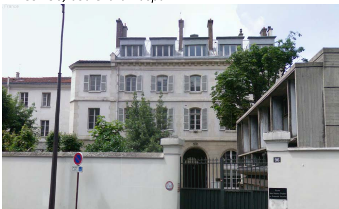
EHESS - 96, boulevard Raspail

Située au carrefour de plusieurs historiographies (histoire de la justice et de la criminalité, histoire des polices, de l'administration et de l'Etat, histoire de l'Eglise, histoire du travail et de la marginalité/pauvreté) l'histoire de la prison et de l'enfermement connaît un renouveau certain. On refuse désormais de considérer la prison sous l'angle exclusif d'un droit de punir reformulé par les réformateurs du 18 e siècle. Toute approche téléologique, en termes de modernisation nécessaire ou de genèse de la prison est désormais récusée, au profit d'une étude comparatiste dans le temps long des singularités « carcérales » et de la circulation et la réinterprétation des expériences de l'enfermement. La relecture du face-à-face entre surveillants et enfermés conduit également à interroger à nouveaux frais les modes de régulation internes aux lieux d'enfermement, la diversité des fonctions qui leur sont assignées et les représentations sociales qui s'y rattachent.