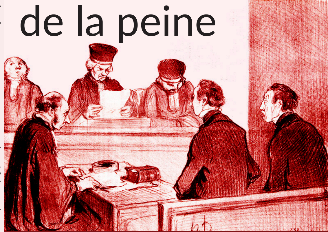
■ Conception : Direction de la recherche ■ Impression : Reprographie campus ■ UPIV ■ Illustration : Caricature de Daumier « Les gens de justice » ■

- Jeudi 14 juin 2018 - Le Logis du Roy - Square Jules Bocquet - Amiens