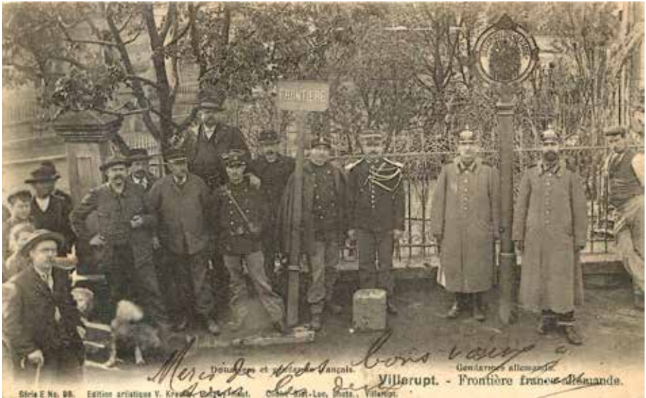
Frontière franco-allemande, Villerupt, 1913.